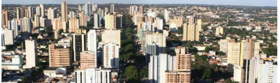
sede | campo grande - ms